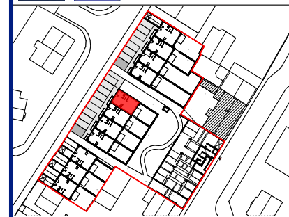
Plan de repérage

SCCV Saint-Brieuc 54 Ferry 31 rue François 1er 75008 PARIS